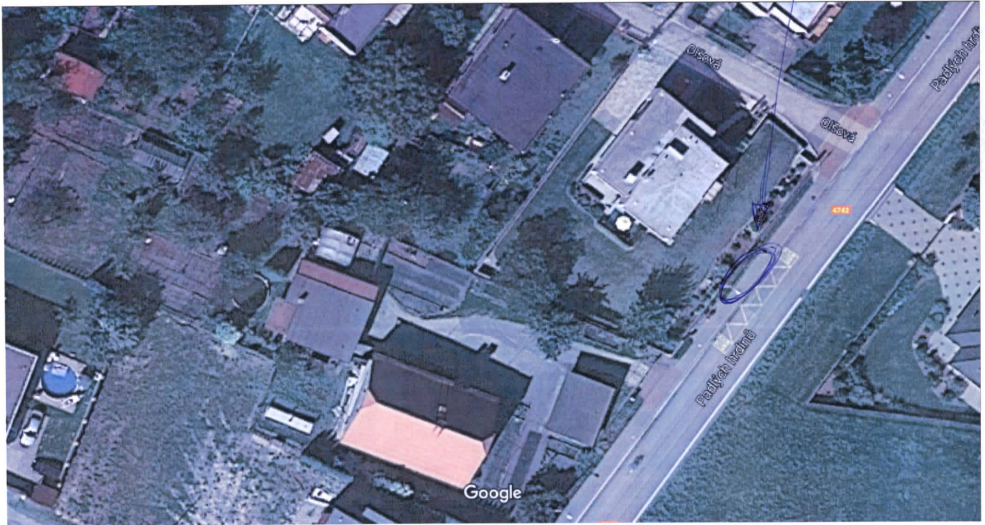
Snímky ©2017 GEODIS Brno, Mapová data ©2017 Google 10 m