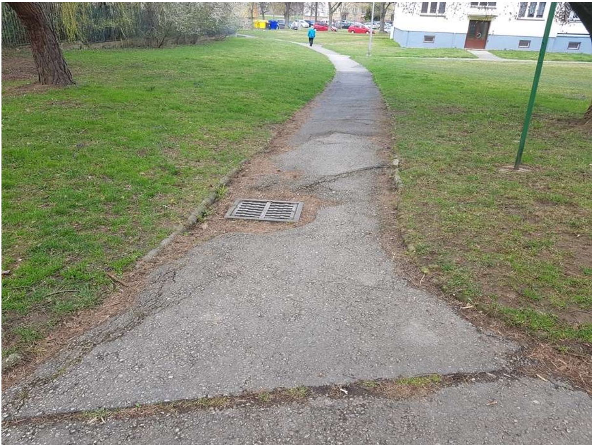
(obrázek č.3 – Majakovského kanál č.2)