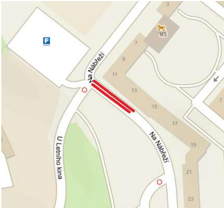
(obrázek č.5 – Přejchod přes cestu)