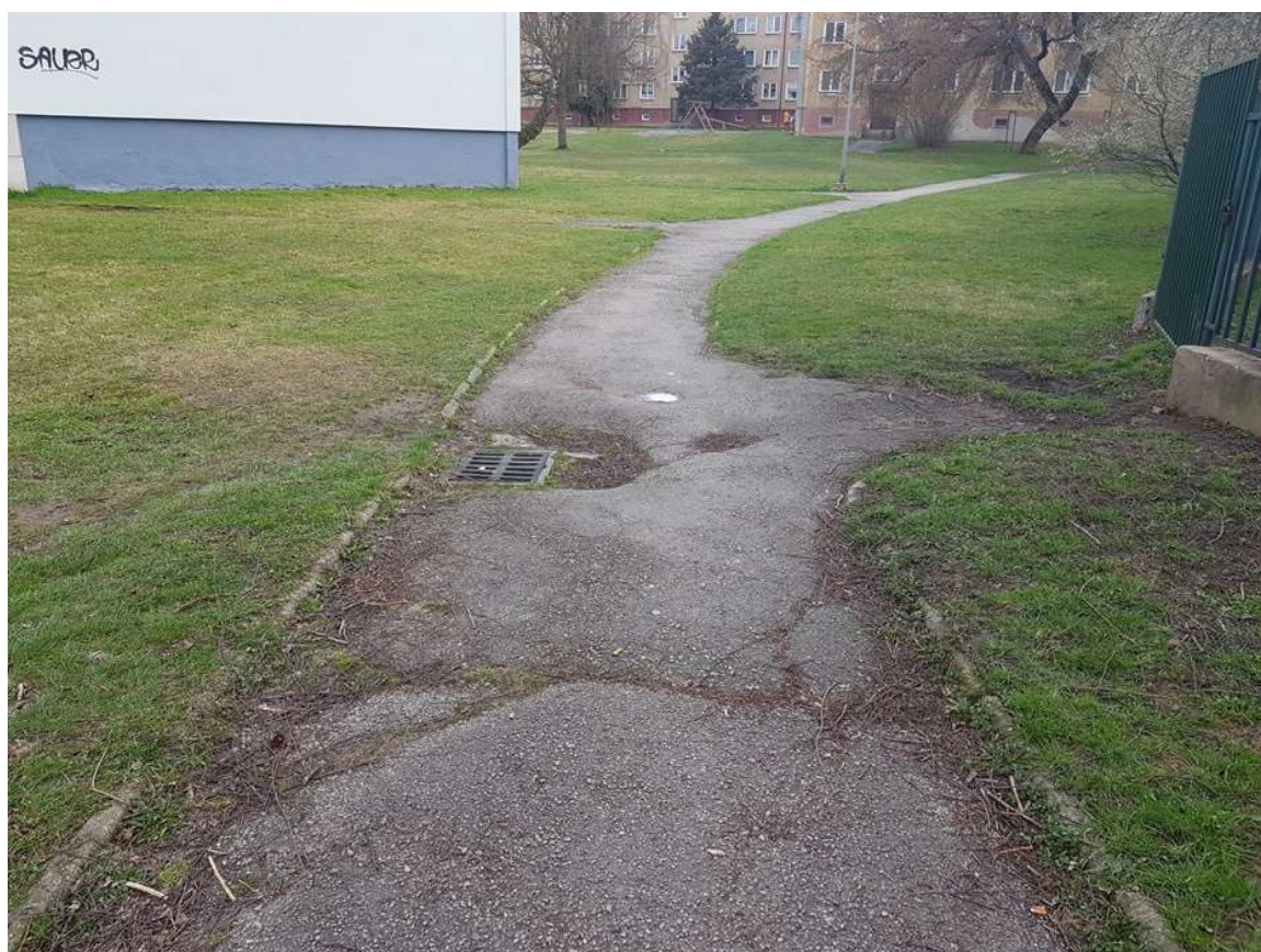
(obrázek č.2 – Majakovského kanál č.1)