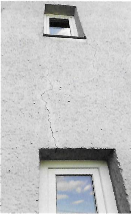
Fasádní trhliny :