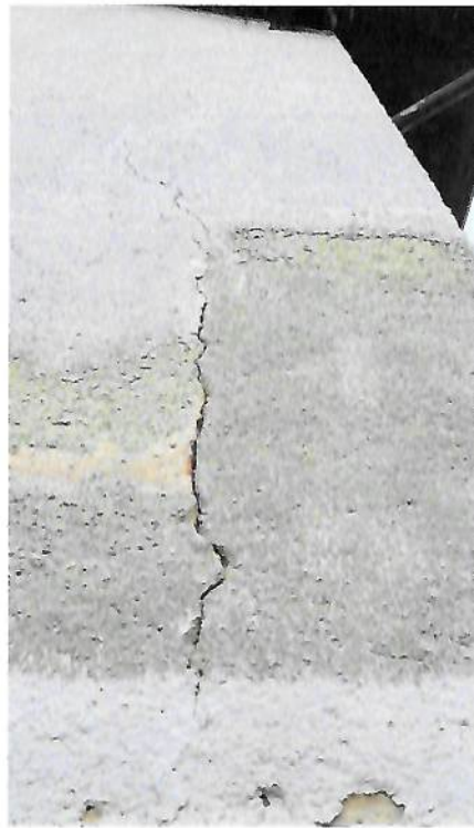
Stav budovy přístavku: