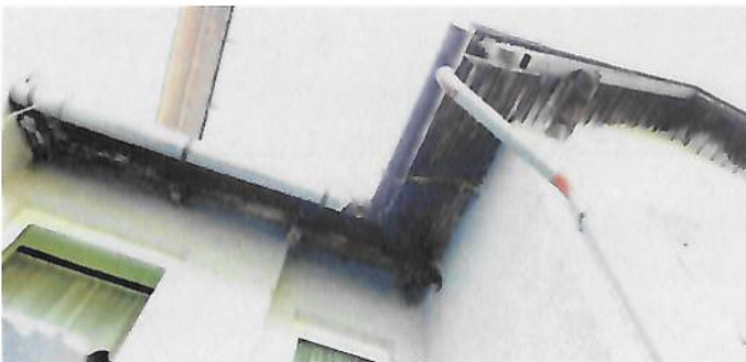
Nevyhovující, napadený a shnilý krov přístavku

– trhliny na fasádě, sanace spár komínu nátěr střešní krytiny vč. oplechování – ideálně výměna a sjednocení krytiny