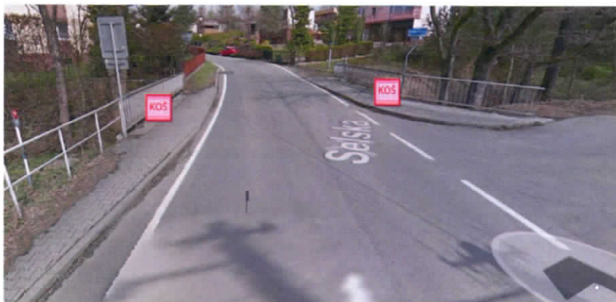
Návrh možného umístění odpadkového koše ulice Selská – mostek přes Stružník